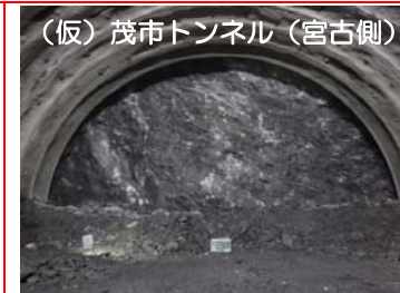
⑤施工：前田建設工業

(仮)茂市トンネルの掘削を行っています。全長1,885mのうち472mまで進んでいます。