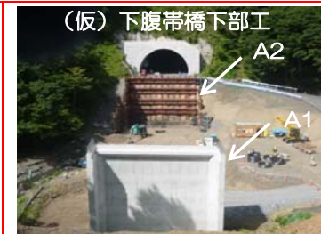
⑧施工：戸田・岩田地崎JV

(仮)下腹帯橋A1橋台では、躯体工事が完了し、埋戻し作業に入っています。A2橋台では深礎杭の掘削作業を行っています。