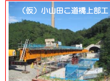
③施工：富士ピー・エス

(仮)茂市トンネルの掘削を行っています。全長1,885mのうち472mまで進んでいます。